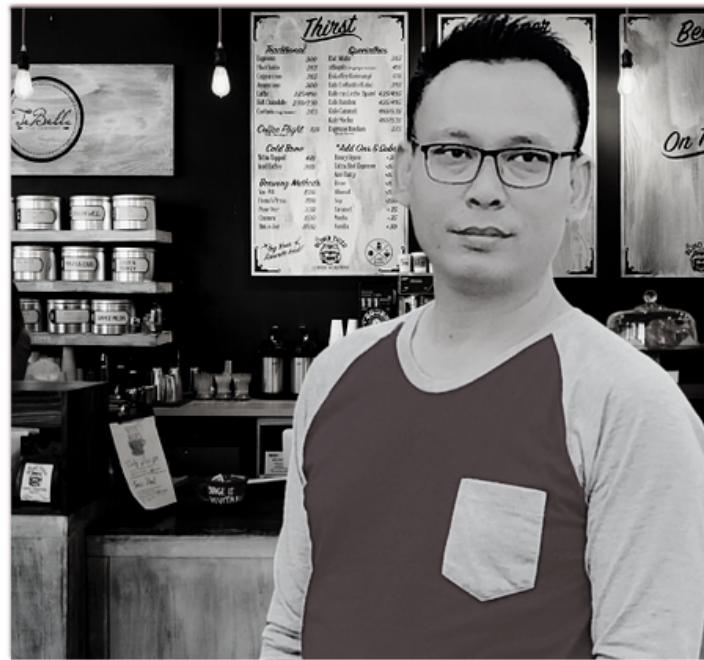
Ariandary Digital Content