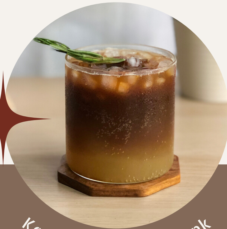
Kopi Jahe Ayank Ayank