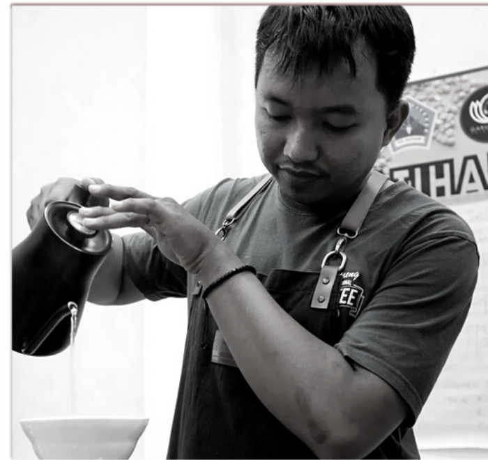
Doni Product Support