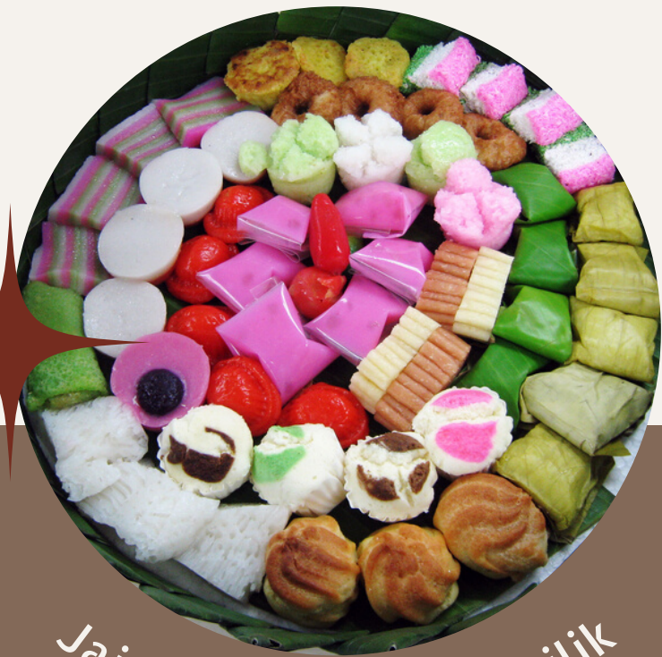
Jajanan Khas Wong Cilik