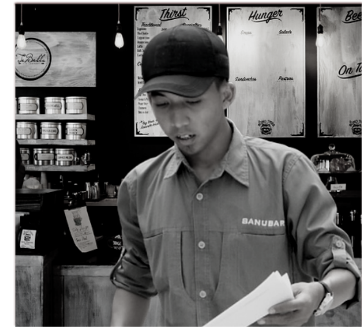
Andy Design Booth