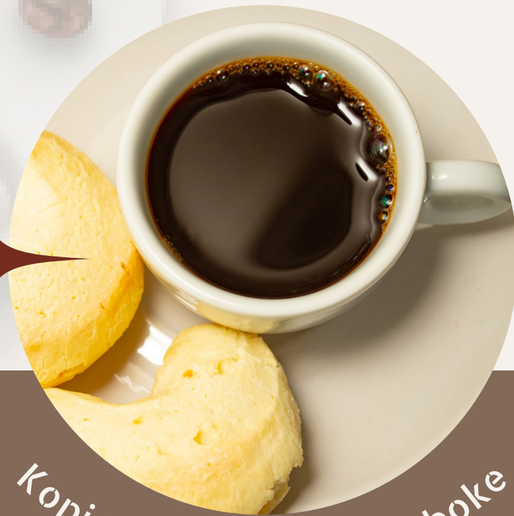
Kopi Ireng Gawene Simboke