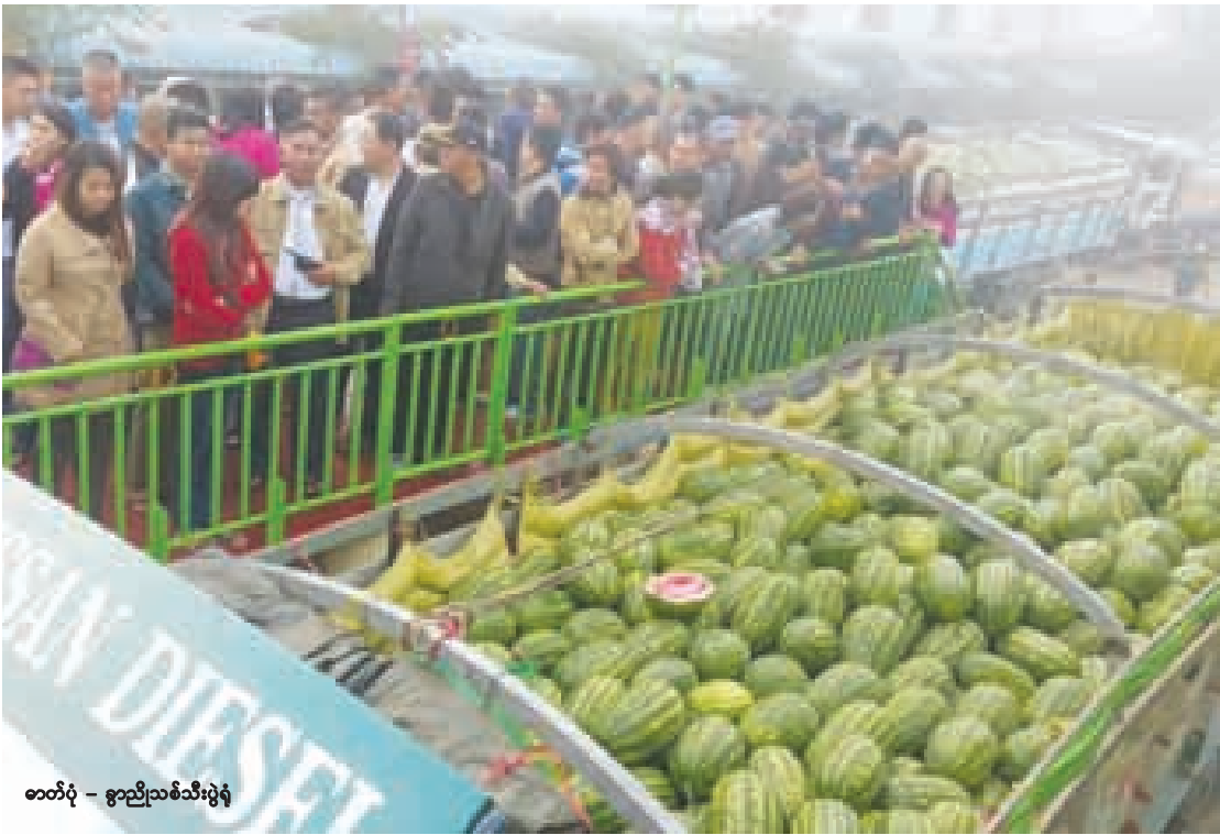
ဓာတ်ပုံ - ခွာညိုသစ်သီးပွဲရုံ

အဆိုပါကုတ်ထုတ်ပေးခြင်းနှင့် မှတ်ပုံတင်လုပ်ငန်းများနှင့် ပတ်သက်၍ အသေးစိတ်သိရှိလိုပါက အကောက်ခွန်ဦးစီးဌာန၊ MACCS ဌာနခွဲ ဖုန်း ၀၁-၃၇၉၄၂၉ ထံဆက်သွယ်မေးမြန်းနိုင်ကြောင်း ယင်းဦးစီးဌာနထံမှ သိရသည်။ ■J-11