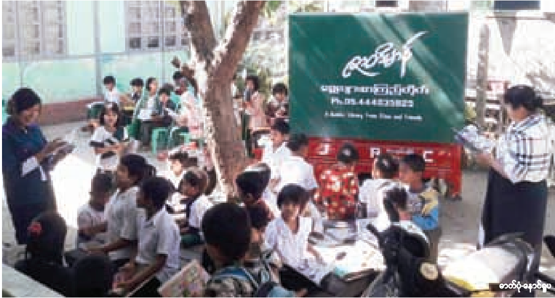
တတိမာန်ရွှေလျားစာကြည့်တိုက်တွင် ငှားရမ်းဖတ်ရှုနေသော ကျောင်းသားများကိုတွေ့ရစဉ်