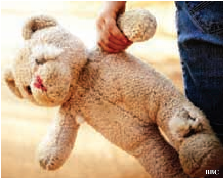
တရားခံ လူနစ်ဦးစလုံးကို အာမခံပေးရန် ငြင်းပယ်ထားပြီး ဆစ်ဒနီရုံးတွင် အင်္ဂါနေ့၌ ရုံးထုတ်စစ်ဆေးမည်