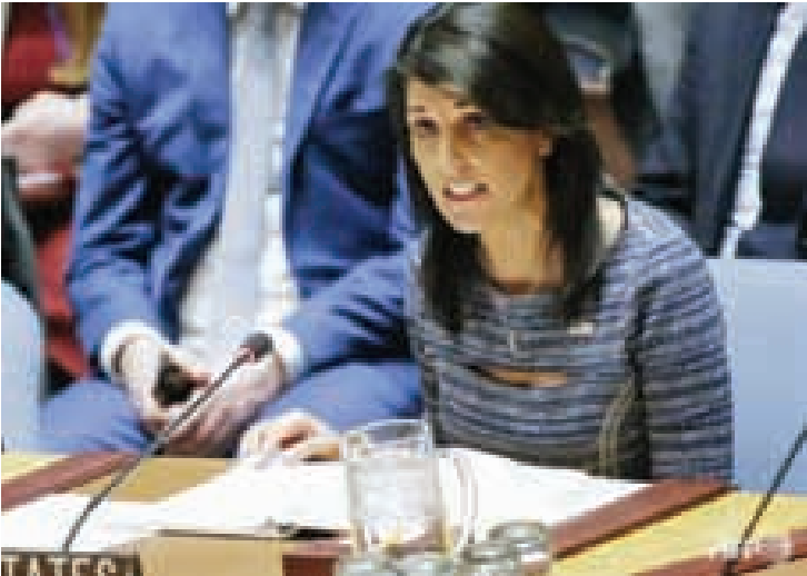
ကုလသမဂ္ဂဆိုင်ရာ အမေရိကန်သံအမတ်ကြီး နစ်ကီဟာလေ

အမေရိကန်ဘက်က ယင်းသို့ ပြောင်းလဲမှုကို ပယ်ချခဲ့ပြီး နောက်ဆုံးတွင် မည်သည့်ကြေညာချက်မျှ အတည်မပြုနိုင်ခဲ့ကြောင်း သံတမန်များက ပြောကြား