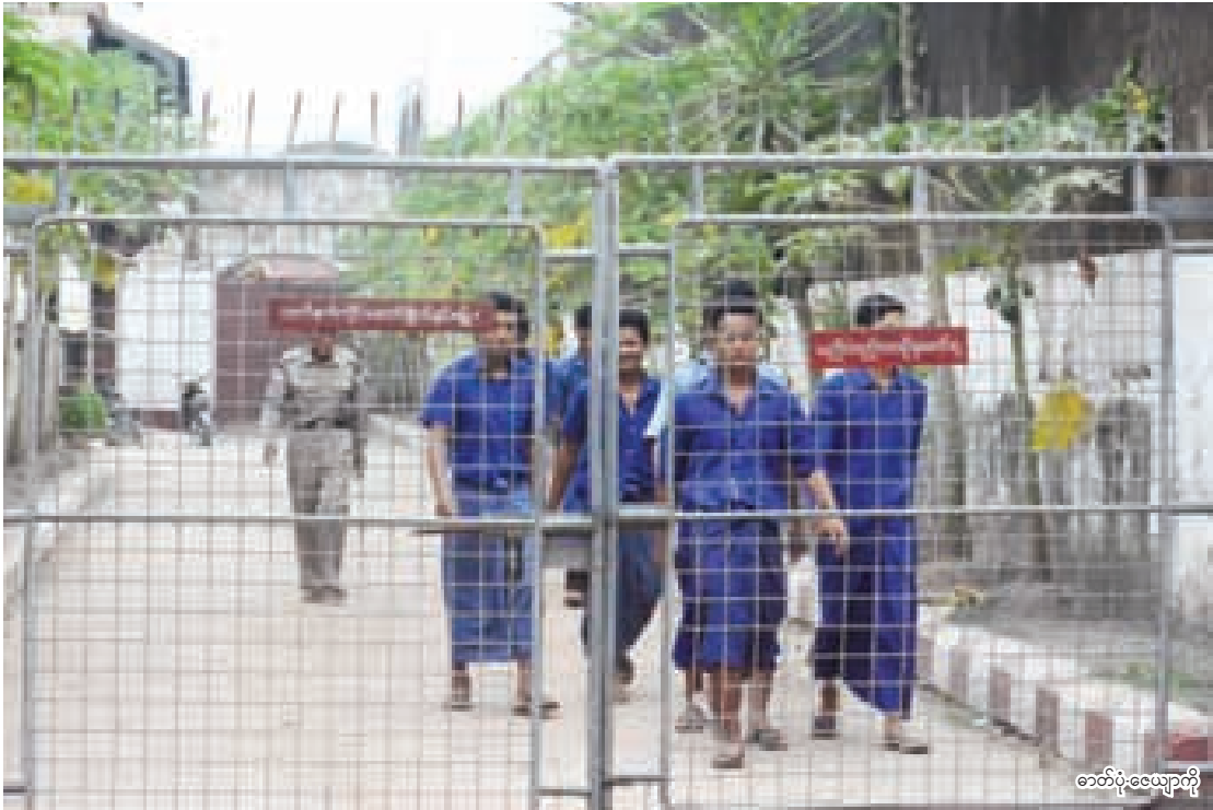
ဓာတ်ပုံ-လျှောက်