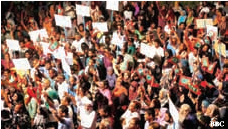
ယခုအခါ သမ္မတယာမင်းကို ဖြုတ်ချ ရန် လှုပ်ရှားမှုမှန်သမျှကို တွန်းလှန်ကြရန် စစ်တပ်က အမိန့်ထုတ်ပြန်ထားသည်

ဗြိတိန်နိုင်ငံခြားရေးဝန်ကြီး ဘောရစ်ဂျွန်ဆင်ကလည်း အရေးပေါ်အခြေအနေကို ရုပ်သိမ်းပေးရန် သမ္မတယာမင်းကို တောင်းဆိုထားသည်။ ■ F-04