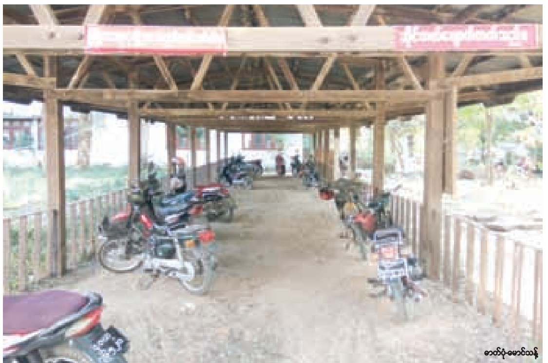
မန္တလေးတက္ကသိုလ်ရှိ ဆိုင်ကယ်ရပ်နားရန်နေရာတွင် သတိပေးစတစ်ကာများ ကပ်ထားသည်ကိုတွေ့ရစဉ်

သည့်အတွက် ကျောင်းသားသမဂ္ဂအနေနှင့် ကျောင်းတာဝန်ရှိသူများနှင့် ညှိနှိုင်းကာ လုံခြုံရေး တိုးမြှင့်လုပ်ဆောင်ရန်ရှိကြောင်း ကျောင်းသားသမဂ္ဂအဖွဲ့ထံမှ သိရသည်။