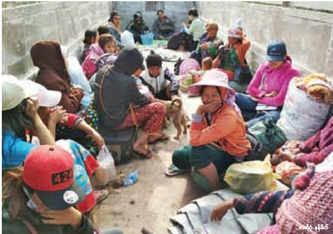
ပိတ်မိနေသောလူများ တနိုင်မြို့သို့ ရောက်ရှိလာသည်ကို တွေ့ရစဉ်

မျက်နှာဖုံး - တနိုင်ဒေသ တိုက်ပွဲအတွင်း ပိတ်မိနေသူ အကုန်လုံးနီးပါးမှ အဆက်