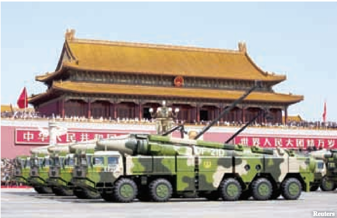
တရုတ် ခုံးကျည်များကို တီအန်မင်ရင်ပြင်၌ ပြုလုပ်သည့် စစ်ရေးပြပွဲတစ်ခုတွင် တွေ့ရစဉ်