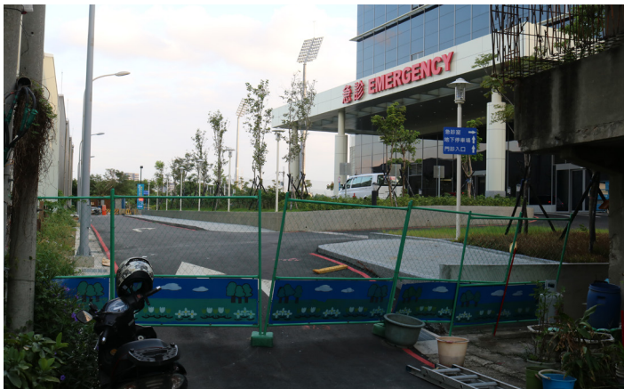
▲圖為輔大醫院急診室大樓。目前聯外道路未開放，救護車及一般車輛走一樣道路進出。