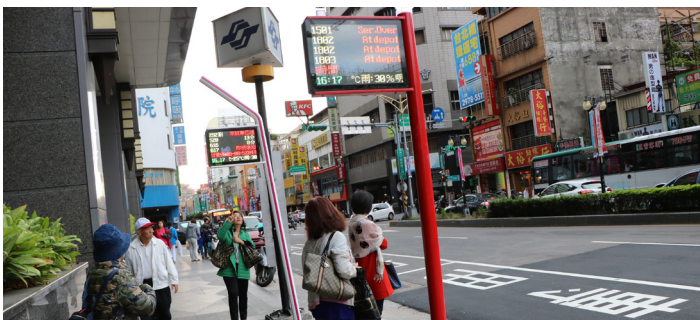
▲圖為捷運台北橋站附近的吸管造型智慧公車站牌。