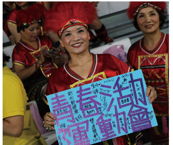
▲雙連水噹噹隊以活力的山地舞，表演張惠妹的演唱曲《站在高崗上》。

新莊區社區照顧關懷據點：長青街三〇號三樓（頭前公共托老中心三樓）。每周二上午九時卅分至十二時卅分，提供新莊區內年滿六十五歲以上之長者或身心障礙者，健康促進、老人營養餐飲等服務。洽詢服務專線(02)8521-7872 分機105。