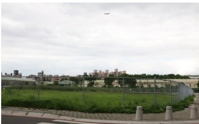
▲鄰近機捷A3新北產業園區站的新莊北側知識產業區土地有九筆未標脫。

本次是新莊北側知識產業園區土地第三次標售，包含四筆第二種住宅區，與六筆產業專用區，底價每坪分別為90.58萬元起和73.72萬元