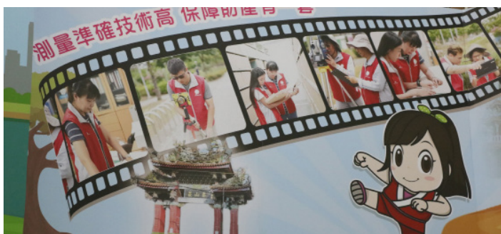
▲新莊地政所新的形象代言人「新五林女孩-泰厲害」。

另外，因應高齡社會來臨，為鼓勵年輕人與銀髮房東共居，今年銀髮房東也可申請一萬元的住宅修繕補助。銀髮房東資格為，年滿六十歲以上且戶籍設於本市境內之自有住宅地址，並將該住宅之空房，分租予非屬直系親屬之單身或新婚青年而共同居住者。