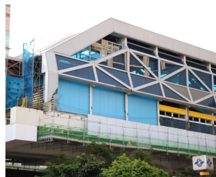
▲新北市捷運環狀線頭前庄站目前仍在施工當中。

三環三線的第一環，是指環狀線第一階段、第二階段（南、北環段），加上已通車的文湖線。第二環為萬大—中和—一樹林，結合已通車的