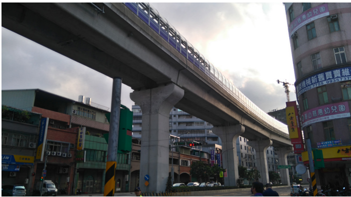
▲機場捷運軌道鄰近民宅，將增設遮光隔音牆降低夜間光害和噪音。

機場捷運從今年二月開始試營運，每日上午四時發車、晚上十一時末班車；但是再加上例行的軌道檢