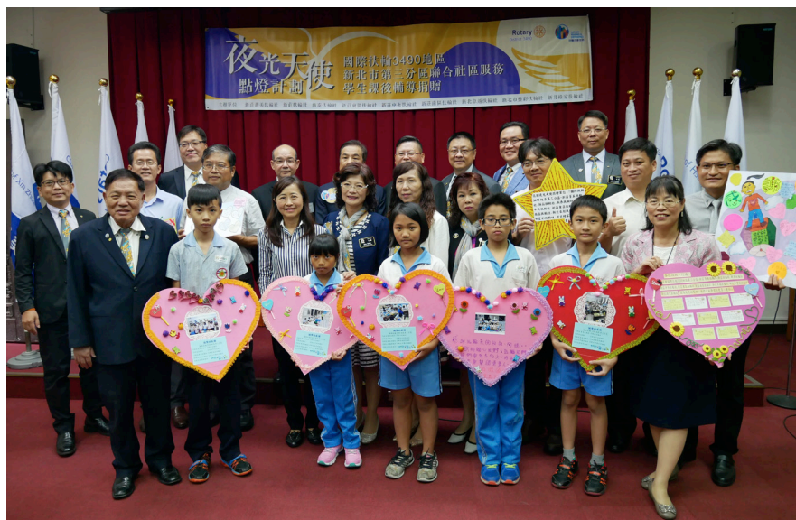
▲受到夜光天使計畫幫助的學童代表，致贈手做卡片感謝扶輪社。