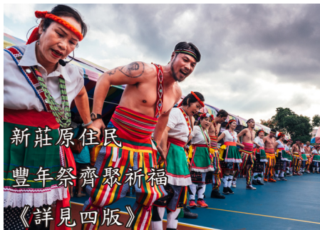
新莊原住民 豐年祭齊聚祈福 《詳見四版》