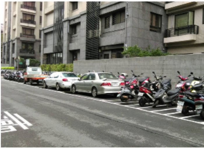
▲長青街三七巷新增的停車位，預計裁撤一格汽車改成機車停車位。

為了改善騎樓機車停車秩序及維護行人通行空間，交通局配合公安聯合稽查小組，從民國一〇五年六月開始，針對市內弱勢避難場所進行稽查。新莊區目前已經有約五十處實施機車禁停騎樓措施，範圍不只有長照中心，公共場所或交通繁忙的路段都會陸續列入管制，請民眾多加留意。