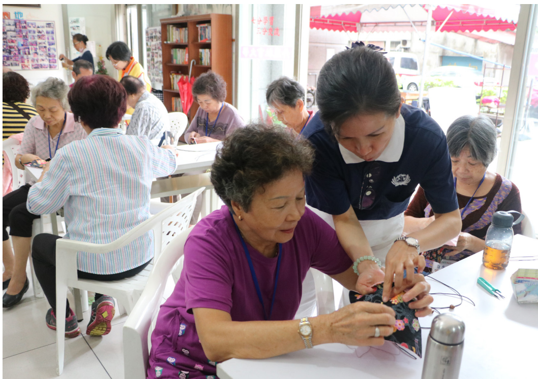
▲慈濟志工教導長者縫紉「布包」。