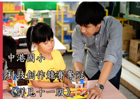
中港國小 科技創作競賽奪冠 《詳見十一版》