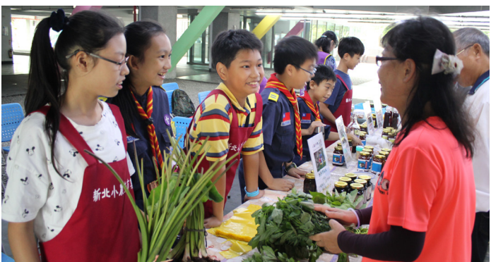
▲學生親自販售學校自種的農產食物。

為，「有努力不一定有收穫，但沒努力就一定不會有收穫，就算有收穫也不要驕傲，因為前面還會有更大的挑戰。」