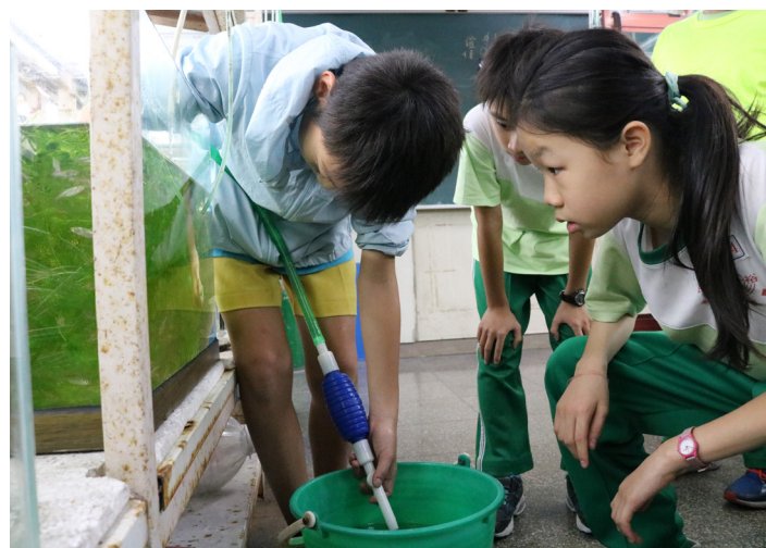
▲裕民國小學生照顧魚類。

學生每天早自習與午休參與這門課。他們不覺得累，因為從課程中，不單學到魚類知識，更能實際操