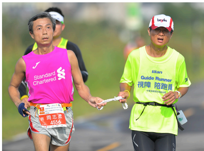
▲視障人士由陪跑員一同陪跑參與盛事。

惠光導盲犬學校也希望能舉辦使用者說明會、導盲犬體驗營，預計提供兩百位名額給視障朋友。並預計完成四組使用者與導盲犬隻配對及共同訓練，讓六位使用者及其家人受惠。