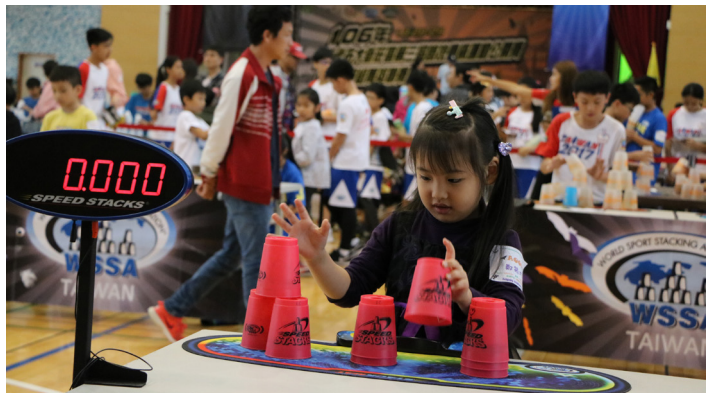
▲新莊區第三屆競技疊杯運動公開賽會場。

【記者楊婷婷報導】十月廿八日上午舉行了「2017大新莊區第三屆競技疊杯運動公開賽暨甲組菁英聯賽」，結合萬聖節鬼魅氣息，多位參賽選手扮成殭屍、女巫等特殊造型，由現場民眾票選前三名最佳造型獎。新北市議員何淑峰也扮成女巫分送糖果，她表示，希望大家能在疊杯這項老少咸宜的運動中找到自己。