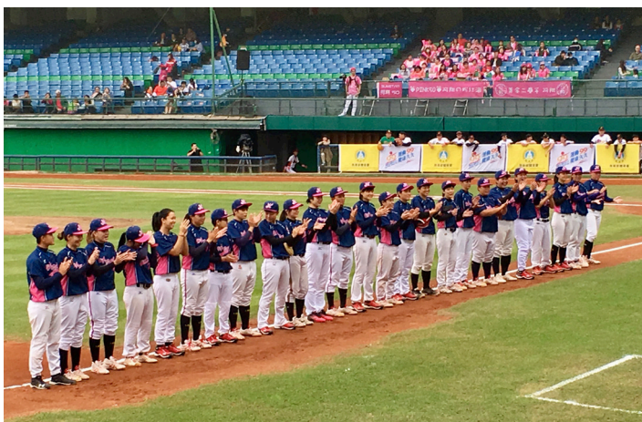
▲台北御聖High Match女子棒球隊合影。

本次活動與唐氏症基金會合作，比賽前的開場由唐氏症基金會閃亮家族帶來歡樂及有活力的舞蹈。民眾入場不需要費用，只要準備當月五張發票，賽事結束後全數捐出。