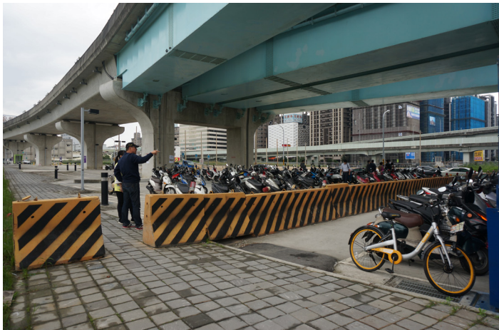
▲機場捷運A3站一號出口的自行車停車場，非供機車停放。

機場捷運在A3新北產業園區站一號出口旁規劃收費式汽、機車及自行車停車格，小型車日間臨停每小時卅元，機車每次廿元，但是對民眾而言，免費的停車位吸引力較大，何淑峰詢問：「能不能夠將原本規劃的機車停車場調整為免費？」桃園捷運公司代表則表示，還要再回公司商討。