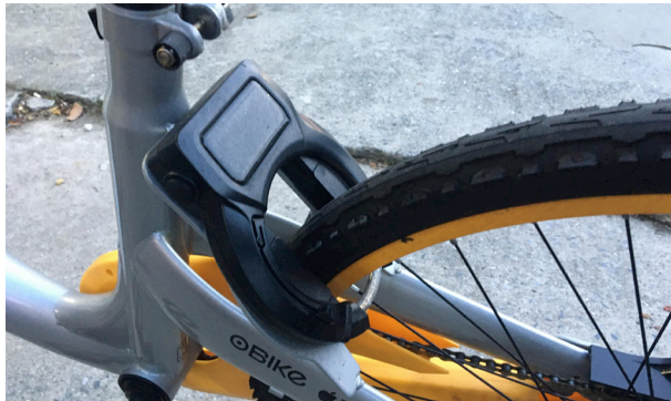
obike上的黑色鎖頭。

警方表示，能夠迅速逮人，關鍵在每台obike上都有的黑色鎖頭。當天嫌犯騎乘的obike明顯遭到破壞。而且obike的車尾部分都有車輛編號，只要上網查詢，即可看到租借狀態以及是否為失竊車。obike公司也建議，為維護自己權益，民眾如果要離開一定要把車子鎖好。